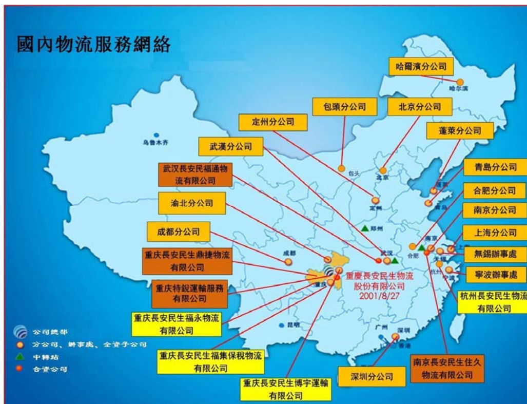
圖二：公司目前的分支機構分佈圖

截至 2013 年 12 月 31 日止，本公司累計建立分公司、子公司、聯營企業和辦事處 23 個，主要分佈在華東、華中、華北、華南和西南地區（圖二）。不斷完善的服務網路，令本集團能提供物流服務至全國各地。